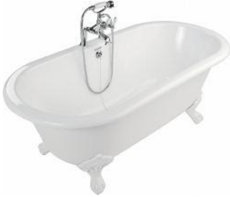
Windemere dobbel ende 1.750 x 800 m.m. badekar uten hull for montering av kar batteri som man kan borre selv på karetts langside.

Dette gjennomfargede materialet helles så i en form hvor det herder til ønsket produkt. Kvaliteten på støpemarmor er ekstremt god og ripefast og kan svært enkelt repareres hvis man mot formodning skulle få riper i overflaten. Man kan om ønskelig også male / dekorere yttersiden av badekar i dette materialet.