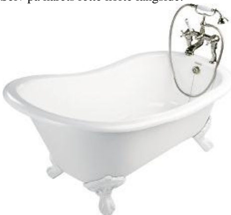
Derwent slipper 1.550 x 750 m.m. badekar uten Hull for montering av kar batteri som man kan borre selv på karetts korte, lave side.