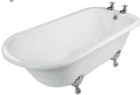
Coniston 1.710 x 780 m.m. badekar uten hull For montering av kar batteri som man kan borre Selv på karetts rette korte langside.