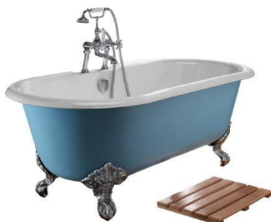
1.700 m.m. Bentley badekar, 0 eller 2 hull til montering av kar batteri

Prisliste for frittstående støpejerns badekar med ball og klo ben