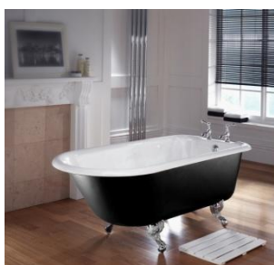
1.700 m.m. Waldorf badekar, 0 eller 2 hull til montering av kar batteri