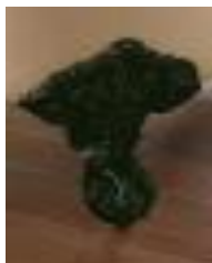
For egen dekorering