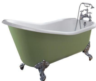
1.700 eller 1.540 m.m. Ritz slipper badekar, 0 eller 2 hull til montering av kar batteri